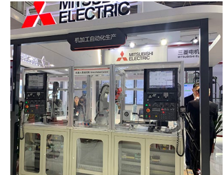
ロボット連携ソリューション

PRODEX 2019 <スイス> (5月14日~17日) スイス・バーゼルで開催された工作機械見本市「PRODEX 2019」に出展いたしました。当社ブースではCNC M800/M80/C80シリーズの最新機能紹介や稼働状況の見える化を実現する稼働監視アプリケーション「NC Visualizer」を展示し、お客様から好評を頂きました。