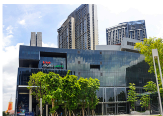
新事務所 バンコク中心地区

当社のタイにおける拠点「MITSUBISHI ELECTRIC FACTORY AUTOMATION (THAILAND) CO., LTD.」(バンコク中心地区)が移転となり、8月26日より新事務所での営業を開始いたしました。また、2019年4月にはコラート地区に新たにサービスセンターを開設し、同国におけるCNCサービス拠点が3箇所となりました。サポート体制を更に強化し、お客様の満足度向上と製造業の発展に貢献してまいります。